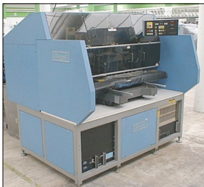
Die Universal Radial Maschine für SEDM beim Probelauf bei ADOPT The Universal Radial Machine for SEDM during the test run at ADOPT